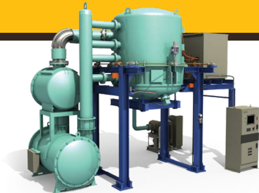
Modèles verticaux à chargement par le bas