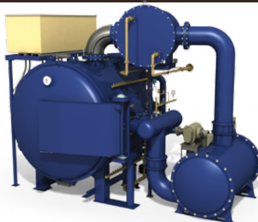
Modèles horizontaux à chargement frontal